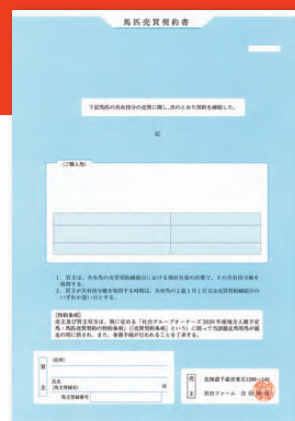
馬匹売買契約書 【地方入厩予定馬用】

売主及び買主双方は、別に定める「社台グループオーナーズ2022年産地方入厩予定馬：馬匹売買契約の特約条項」（「売買特約条項」という）に則って当該競走馬が競走の用に供され、また、事務手続が行なわれることを了承する。